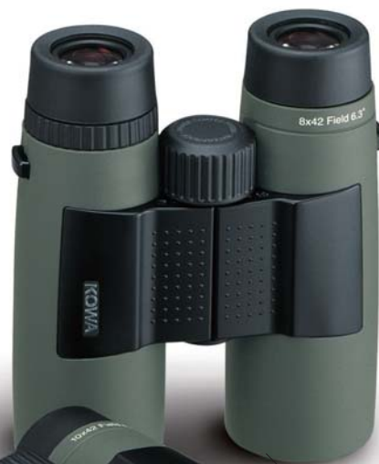
BD42-8GR(8×42DCF) 希望小売価格 ¥73,500(税込)