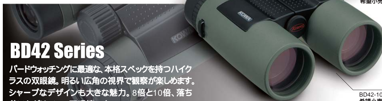
BD42-10GR(10×42DCF) 希望小売価格 ¥78,750(税込)