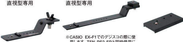
TSN-PS1 希望小売価格 ¥16,800 (税込)