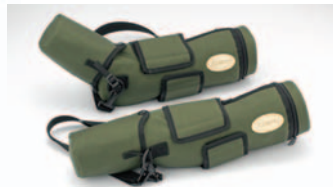
TSN-770シリーズ C-771 (傾斜型用)/C-772 (直視型用) 希望小売価格 ¥8,400 (税込)