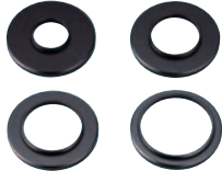
TSN-AR28/30/305/37/43/46/52/55/58/62/72/750 希望小売価格 各種 ¥2,625 (税込) AR750 ¥3,675 (税込)