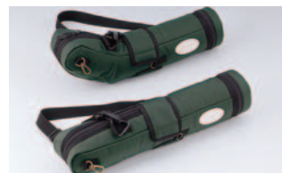
TSN-600シリーズ C-601 (傾斜型用)/C-602 (直視型用) 希望小売価格 ¥6,300 (税込)