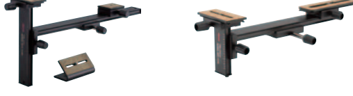
※TSN-881/883/771/773では使用できません。 TSN-DA3 (直視型/傾斜型) 希望小売価格 ¥21,000 (税込)