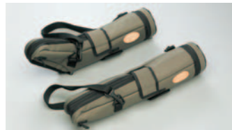
TSN-660シリーズ C-661 (傾斜型用)/C-662 (直視型用) 希望小売価格 ¥6,300 (税込)