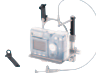
TSN-DA4-RS 希望小売価格 ¥8,400 (税込)