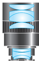
TE-17W 30×W 希望小売価格 ¥42,000 (税込)

5群7枚構成の高性能設計により、アイレリーフ20mmの見易さと広視野の両立を実現しています。従来機種よりも約1割広い実視野を確保したワイド設計で対象物を導入しやすくなりました。アイレリーフ20mmのハイアイポイント設計によりメガネをかけても全視野見渡せます。