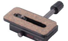
TSN-BP 希望小売価格 ¥5,250 (税込)