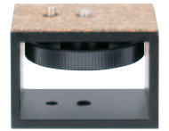
TSN-DA3-40 希望小売価格 ¥4,725 (税込)